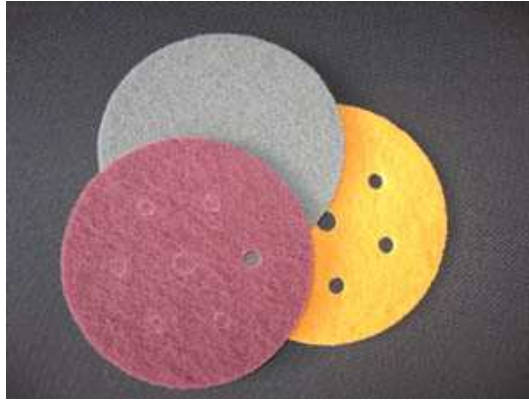
skoc-brajt za masinsko brusenje

Ova vrsta abraziva moze se naci u 3 finoce i to P320 (grubi), P800 (fini) i P1000 (ultra-fini). Dovoljno je da sa skoc-brajtom P800 osmirglate plastiku tako da svuda ravnomerno "pobeli".