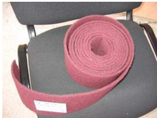
skoc-brajt za rucno brusenje

Prvo sto moramo uraditi sa plasticnim delom je dobro ga pripremiti za samo farbanje. Dobra priprema je osnov uspesnog posla ne samo kad je farbanje plastike u pitanju vec i svega ostalog. Na koji nacin ce se neki deo pripremiti zavisi od njegovog trenutnog stanja. (novi deo, vec farban deo sa postojanom bojom na sebi, sa bojom koja se ljusti, osteceni deo u smislu dubokih ogrebotina...) Prvo sto cemo uraditi a bez obzira na trenutno stanje površine pl.dela je smirglanje. To je deo posla koji retko ko voli. Ako se radi o novom ne farbanom pl.delu najbolje je koristiti SKOC-BRAJT.