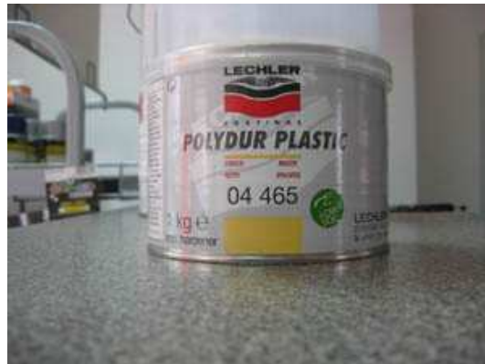
polidur-plastic za popunjavanje ostecenja na pl.povrsinama.

raznih proizvodjaca, a jedan od njih je: