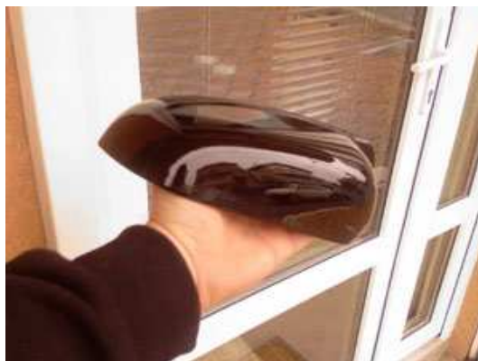
I konacan izgled ofarbanog pl.dela.

Filler u ovom slucaju nije koriscen jer se radilo o novom delu.